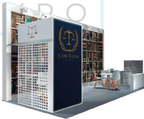
Imagen y elementos decorativos orientativos