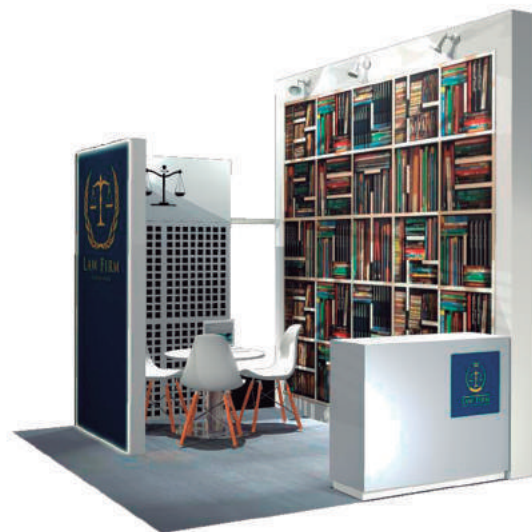
Imagen y elementos decorativos orientativos